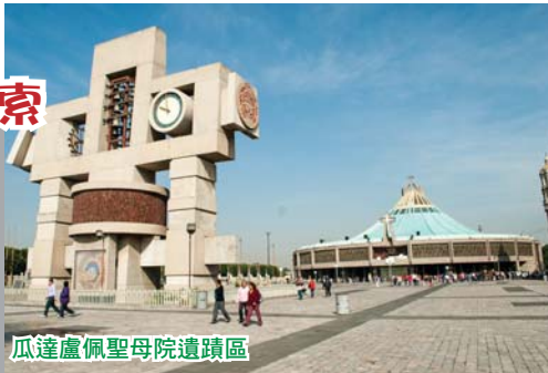
瓜達盧佩聖母院遺蹟區

墨西哥的國家朝聖地。依山而建，坐落在墨西哥城區北邊的特佩亞克聖山腳下。聖母大教堂是世界天主教的奇觀，被羅馬教父認為天主教三大奇蹟教堂之一